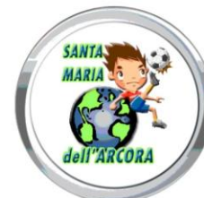
Parrocchia Santa Maria dell'Arcora