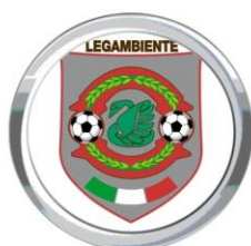
Associazione Culturale Lega Ambiente A.g.a.