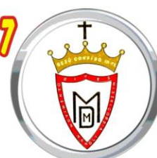
Movimento Dives Misericordia