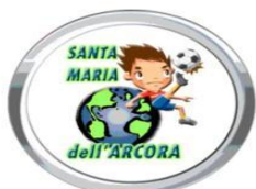
Parrocchia Santa Maria dell'Arcora

Gioco per te Signore nella lealtà, nel silenzio, nella sincerità e già pregusto , con il tuo aiuto la gioia di una vittoria cristiana, schietta e genuina.