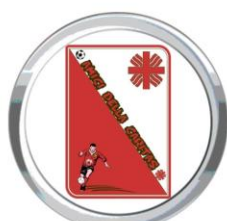
Associazione Parrocchiale Amici della Caritas