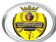
Parrocchia Santa Maria delle Grazie Casarea