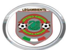
Associazione Culturale Lega Ambiente A.g.a.